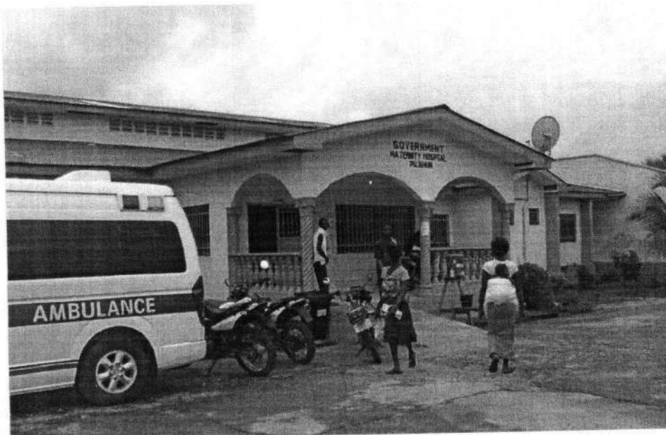
Ospedale Materno Infantile di Pujehun

L'obiettivo primario dell'intervento del Cuamm nel distretto è quello di ridurre la mortalità materna e infantile nel distretto intervenendo presso le strutture sanitarie presenti e, in particolare, presso l' Ospedale Materno Infantile di Pujehun (50 posti letto).