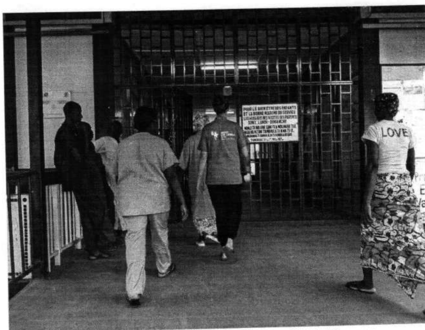
Inizia la giornata in ospedale per i medici del Cuamm