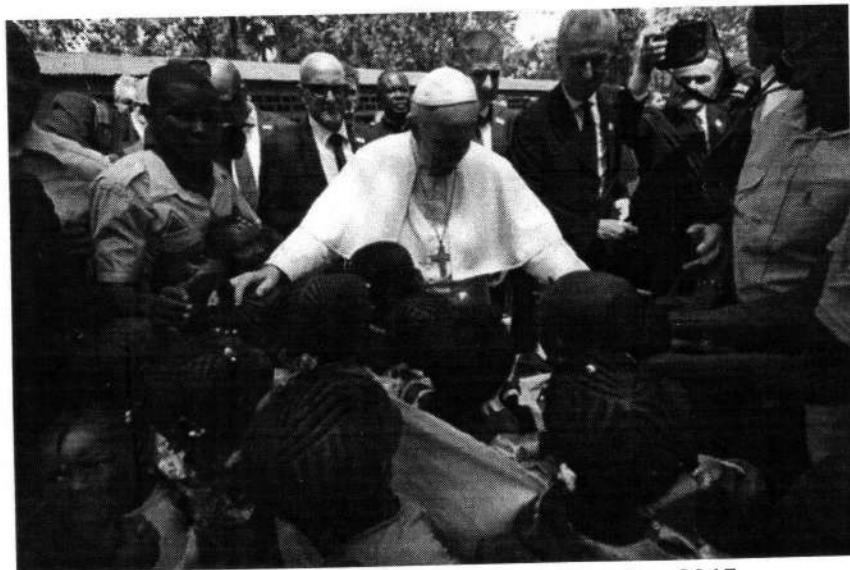
Papa Francesco a Bangui, nel novembre 2015

È proprio in Centrafrica che Papa Francesco nel novembre 2015 ha voluto concludere il proprio viaggio apostolico dando inizio al Giubileo della Misericordia , con l'apertura della Porta Santa della Cattedrale di Bangui , diventata la " capitale spirituale del mondo ".